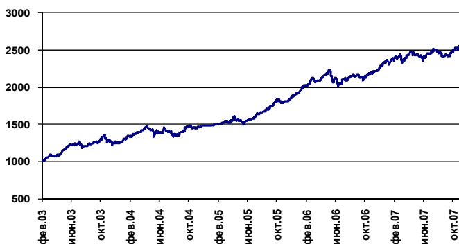
Динамика расчетной стоимости пая, %